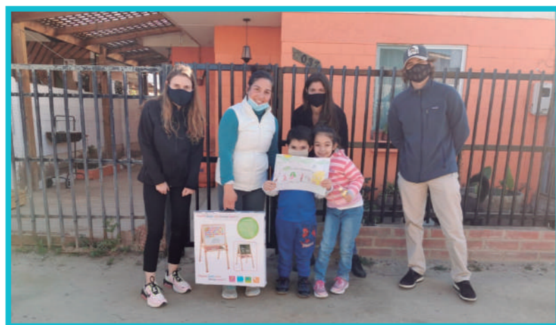
Premiación concurso de dibujo 18 de Septiembre

En cuanto a los resultados, el programa permite hipotizar efectos deseados, sin embargo, es un área en que se debe seguir trabajando para conocer con mayor certeza el impacto generado.